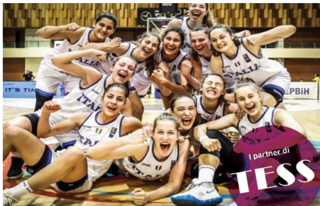
Le ragazze del basket under 18

Quali i contenuti della didattica? Nell'arco dei 5 anni vengono affrontati sia sport individuali che sport di squadra. L'obiettivo è fornire una esperienza nella disciplina trattata, approfondirne le conoscenze e verificarne le competenze, questo con l'aiuto delle Federazioni Sportive e delle Associazioni Sportive presenti sul territorio. Ci proponiamo di arrivare