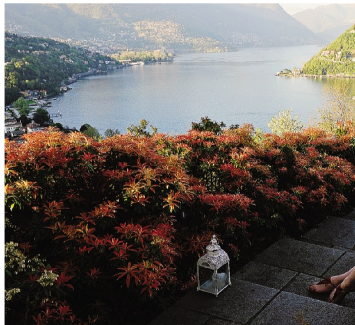
Un'immagine evocativa del lago in "Enjoy Como"